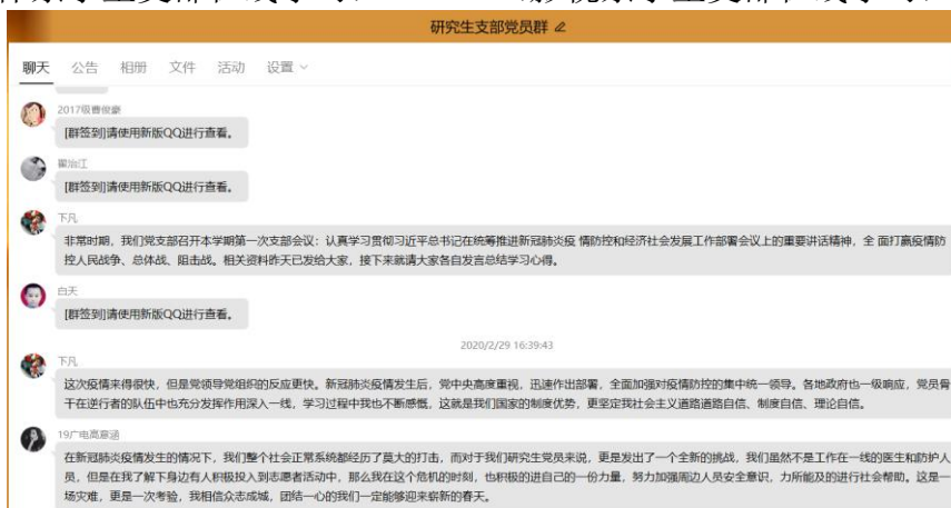
(研究生支部在线学习)

疫情防控期间，学院党委书记、支部书记扎实开展讲党课活动。2月27日，院党委书记郑志坚在所在支部分享《制度优势是抗击疫情的最大保证》，他指出，制度优势是一个政党、一个国家的最大优势，是我们党和人民经受住各种风浪考验的信心和底气所在。当前，我们正面临防控新冠肺炎疫情的严峻考验，我们相信，把思想和行动统一到习近平总书记重要讲话、重要指示精神