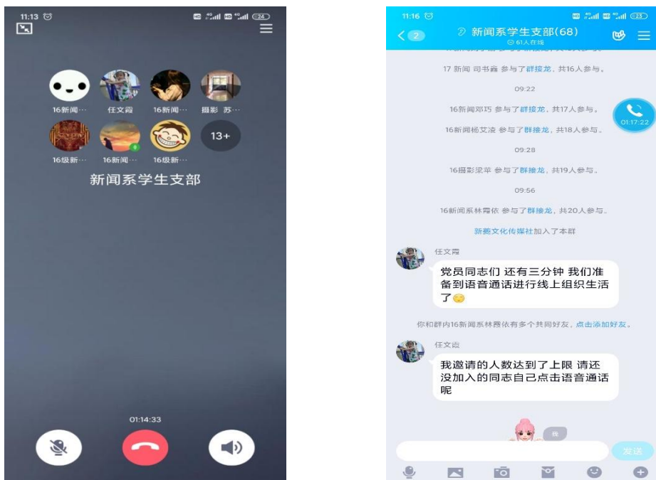
(新闻系学生支部在线学习)

2月至3月，各支部以“战疫进行时，党员在行动”“坚定理想信念，永葆政治本色”为主题开展主题党日活动，各支部通过线上语音连线、群消息沟通等方式进行主题教育。认真学习贯彻《习近平总书记在统筹推进新冠肺炎疫情防控和经济社会发展工作部署会议上的重要讲话》等内容，并围绕在疫情期间全国各地涌现出的先进人物和感人事迹组织开展“向榜样看齐”主题活动。学院7个支部均按照要求保质保量开展组织生活，线上“三会一课”成效显著，党员讨论交流热烈，共收到心得体会70余篇。