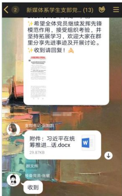
(新媒体系学生支部在线学习)